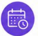
ГРАФИК РЕАЛИЗАЦИИ ДОПОЛНИТЕЛЬНЫХ ПРОФЕССИОНАЛЬНЫХ ПРОГРАММ